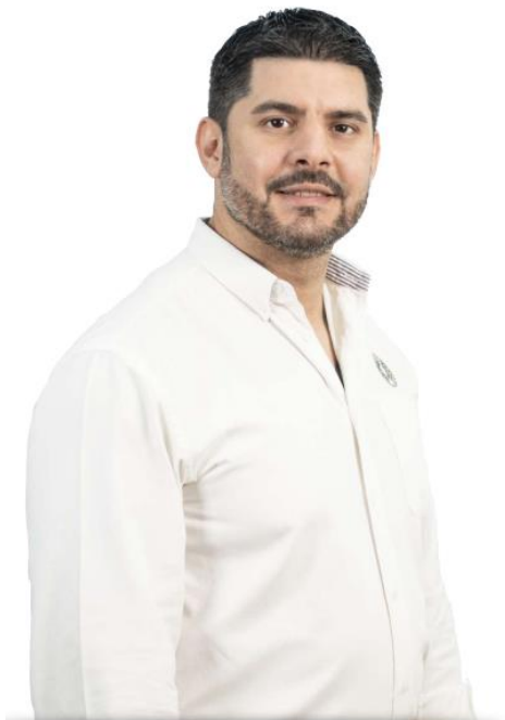
ING. ÓSCAR (NENECHO) RODRÍGUEZ INTENDENTE MUNICIPAL DE ASUNCIÓN

El orden es fundamental para construir. Parte de este Orden constituye el cumplimiento del deber de rendir cuenta de las gestiones realizadas durante el año 2021, y en esta labor estamos aquí para poner a conocimiento de ustedes, la ciudadanía y autoridades en general, las acciones que hemos encarado y anticipar alguno de los proyectos que tenemos planeado llevar adelante. Antes de hacer este recuento, queremos dar nuestro agradecimiento a todos a quienes de alguna u otra manera han colaborado con nuestra gestión y quienes han permitido superar un año de muchos desafíos. A cada uno de los ciudadanos... Al personal de salud, a nuestro personal municipal... A las instituciones públicas y privadas, y a organismos internacionales cooperantes... Estamos convencidos que para llevar adelante los grandes cambios que necesita nuestra ciudad debemos hacer prevalecer el orden social; hallar, en comunión con la ciudadanía, la armonía para trabajar en paz entre todos los sectores que forman parte de la sociedad asuncena, más allá de cuestiones ideológicas, raciales o religiosas, la ciudad debe el centro donde converjan los mejores esfuerzos entre el sector privado y el público, en la búsqueda de los grandes objetivos propuestos.