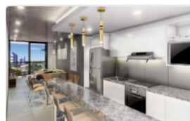
Departamento 2 Dormitorios Tipo B