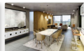
Departamento 3 Dormitorios Plus