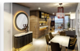
Departamento 3 Dormitorios