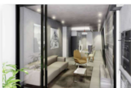
Departamento 2 Dormitorios Tipo A