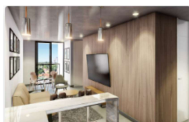
Departamento 1 Dormitorio

Design Center S.A., una empresa con más de 30 años de vigencia en el mercado desarrolla, proyecta y construye Sol City, el primero de un estilo innovador de emprendimientos inmobiliarios en el exclusivo barrio las Lomas.