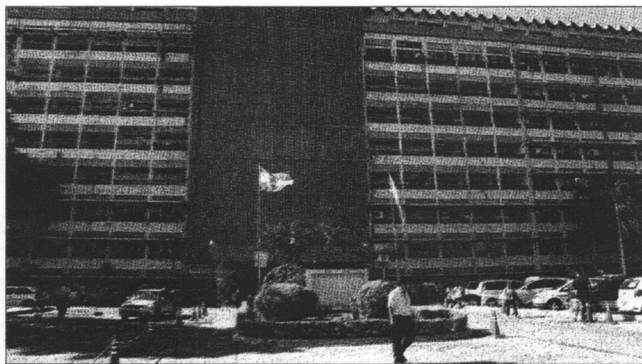
El Instituto de Previsión Social apunta a la diversificación de sus fondos para una mayor rentabilidad y fuerte inyección en obras.

"Es una herramienta que estamos buscando cuando hablamos de financiar las obras del IPS. Creemos que se debe tener un plan financiero acorde para ir creciendo en infraestructura, debido al déficit que se tiene en esa materia y que finalmente, son los asegurados quienes pagan las consecuencias porque no cuentan con las comodidades y atenciones que requieren", expresó el titular del ente.