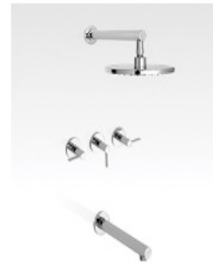
Ducha Guilty Lever