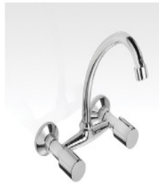
Grifería De Cocina Domani