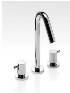
Grifería Linea Coppa