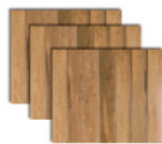
Porcelanato Parquet Caramelo AC 60x60