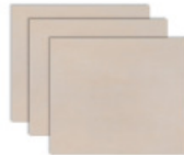
Porcelanato Munari Marfim AC 60x60